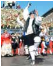
Maño (persona de Aragón)