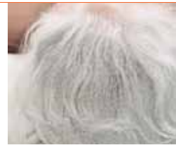
Canas (pelo blanco)